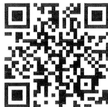
新規登録 QR コード

ログイン後、登録したお写真が画面右上に表示されます。クリックするとデジタル会員証が開きます。編集もそこから可能となります。