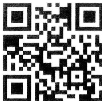
ログイン QR コード