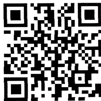
新規登録 QR コード

ログイン後、登録したお写真が画面右上に表示されます。クリックするとデジタル会員証が開きます。編集もそこから可能となります。